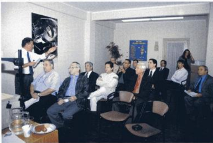
CONCURRENCIA AL CURSO

tas: "sí-no" o "no corresponde". Todos los "no" que les están poniendo y que ustedes avalan y firman como que están de acuerdo, son informados inmediatamente por la ART a la Superintendencia de Riesgos de Trabajo pues éstas tienen la obligación de informar así los incumplimientos de cada uno de los empleadores. La Superintendencia de Riesgos del Trabajo deriva esas denuncias prácticamente on-line a las administraciones provinciales y al Gobierno de la Ciudad de Bs. As. Posteriormente estos entes envían inspectores munidos previamente con la información de los incumplimientos de higiene y seguridad que tienen ustedes en sus establecimientos.