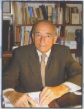
Se debe sostener el crecimiento