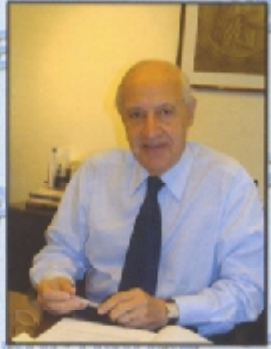
La crisis del capitalismo financiero especulativo